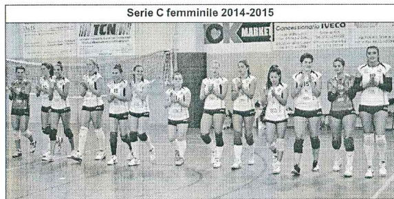
Serie C femminile 2014-2015

l'estetica del palazzetto dando un'accoglienza decorosa a tutti gli atleti ed alunni.